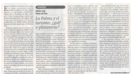
Pérez de Paz, P.L., 2012: La Palma y el turismo: ¿golf o plataneras? Diario de Avisos , 22.II.2012.