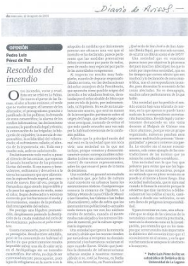
Pérez de Paz, P.L., 2009: Rescaldos del incendio. Diario de Avisos , 12.VIII.2009.